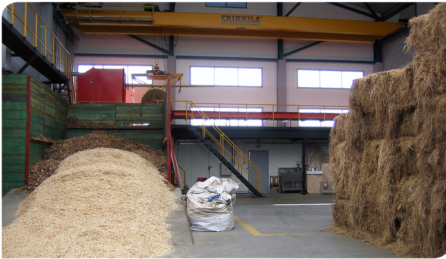
В Лихула топят местным сеном.