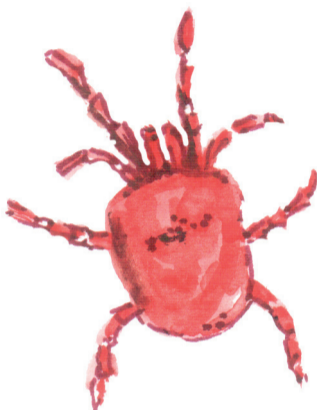
Клещ (красотелка обыкновенная)